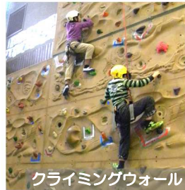
クライミングウォール