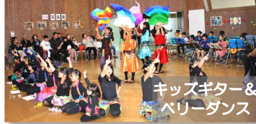
キッズギター&ベリィダンス