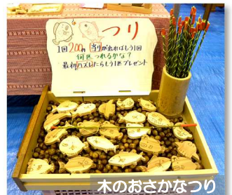
木のおさかなつり