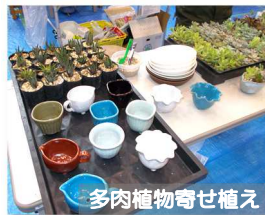
多肉植物寄せ植え