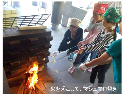
火を起こして、マンシュマロ焼き