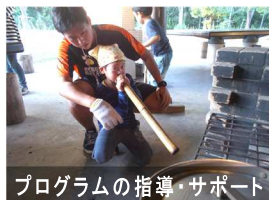
プログラムの指導・サポート