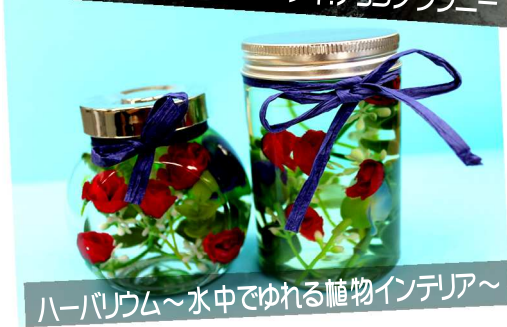
ハーバリウム～水中でゆれる植物インテリア～