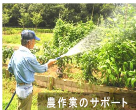
農作業のサポート

自然の家の旬な情報満載のメールマガジン会員を募集中！詳しくはホームページをご覧ください。