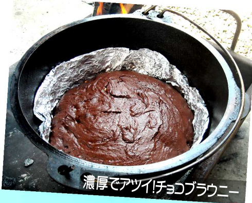
濃厚でアツイチョコブラウニー