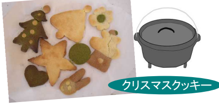
クリスマスクッキー