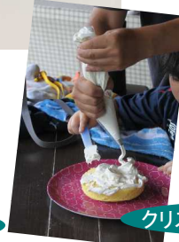
クリスマスケーキ作り