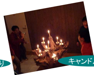
キャンドルナイト