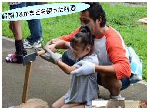
薪割り&かまどを使った料理

新しい出会い 子どもたちは遊びを通して距離が近くなり、初めて出会った子ども同士でも、帰る頃にはお互いの連絡先を交換し合うほど仲良くなっています。