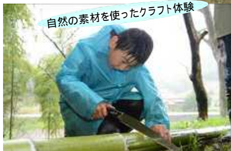
自然の素材を使ったクラフト体験

絆、再発見 かまどを使った料理を行うこともあります。みんなで協力して作る料理は、家族の絆をぐっと深めてくれるはずです。