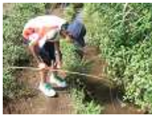
ザリガニ釣りでは、一人で16匹釣った子もいました!