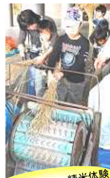
脱穀・籾すり・精米体験

【申込み】往復はがきに必要事項をご記入の上、10月8日(土)までにお申し込みください。 グループでのお申込みもできます。応募の必要事項、詳細はホームページをご覧ください。