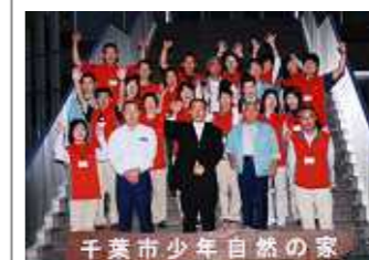
千葉市少年自然の家