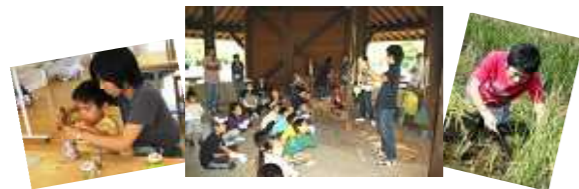
主催事業プログラム指導

千葉市少年自然の家では、子ども達が生き生きと活動できるように健全な育成を手助けしてくれるボランティアを募集しています。お気軽にお問合せください。