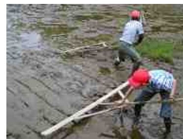
まっすぐに苗を植えるために線を引きました。

さあ、いよいよ田植えです。始めに熊手のような道具を引いて苗を植える目印となる線を付けました。そして、小グループに分かれて順番に苗を植えていきました。皆さん大変手際が良く、予定よりも早く植え終わりました。皆さんの植えてくれた苗が大きく育って、美味しいお米になるのが楽しみです。ぜひ育っていく様子を見に来てくださいね。