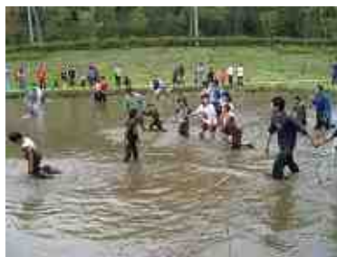
田んぼ遊び。ザリガニ釣りや泥んこ遊びをしました。