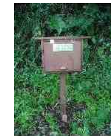
木の箱の中に、ある文字が書かれています。