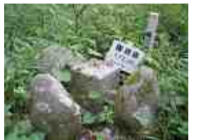
権現森の最高地点