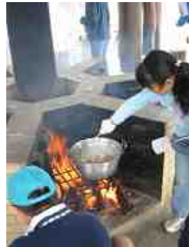
カレーライス作り。家族ごとに違う味に仕上がっていました。

今回は、延べ102名のボランティアの活躍もあり、どの会場でも楽しそうな笑顔、笑い声が起り、時間もあっという間に過ぎていきました。参加されたファミリーの皆さんも満足いただけました2日間だったようです。今後もファミリー対象のプログラムとして「自然の家ファミリーキャンプ」「マンスリーウィークエンドプログラム」を実施していく予定です。どうぞお楽しみに！