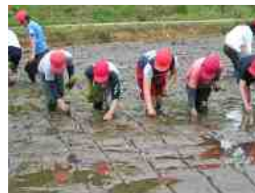
みんな一生懸命に苗を植えました。