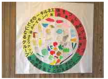
食堂入り口に掲示した食材の色別分類表

「バイキングは食べ放題だからうれしい。」これは、移動教室の児童の感想です。 レストラン森の木ではバイキングという形式を取っています。これは「食べ放題」という意味ではなく、「自分で選ぶ」という事に重点をおいてこのような形式になりました。ところが、どう選べば良いのかという掲示もなく、指導も出来なかったため、「好きなものを好きなだけ食べる」というのが現状でした。