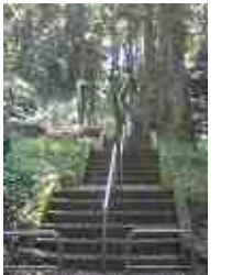
どこに向かうのかな？