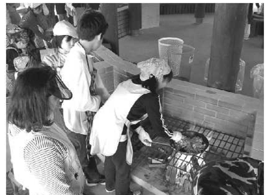
いよいよ、千葉市少年自然の家がスタートしました。今回は、利用者の方々の活動の一コマ「野外炊飯編」です。