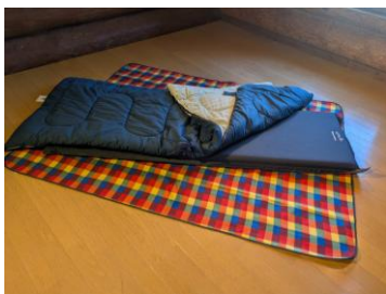
インフレーターマット レンタル代 500円/個

冬のログハウスは使いづらいのでは？と思われがちですが、実はとっても快適！全棟暖房完備なので、冬でも暖かく過ごせます。木の温もりを感じながらプライベート時間を過ごせる自慢の客室です。近くには野外炊飯場もあるので、食事やおやつ作りも気軽に楽しめます。就寝は備え付けの寝袋とマットで。寝心地が気になる方向けにインフレーターマットのレンタル（有料）を開始しました。家族でのんびり、仲間とワイワイ、いろんな目的でご利用ください。