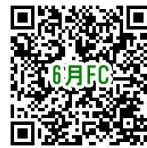
イベント詳細ページ

応募方法 応募フォームに入力 ※応募フォームはイベントページ(下記QRコード)内から