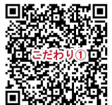
イベント詳細ページ