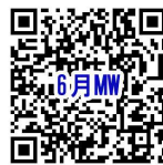
イベント詳細ページ