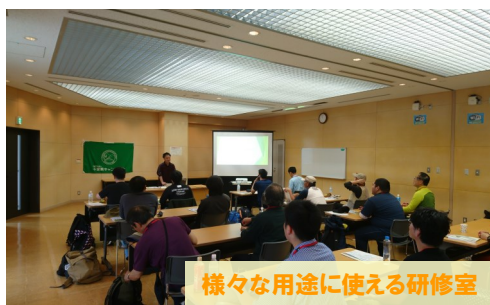
様々な用途に使える研修室

自然の家は、子どものいる家族や少年団体だけでなく、“大人だけ”でも利用ができます。家族や友人との自由な休日、地域のサークル活動や企業研修など、いろいろな形で利用してみてください。宿泊はもちろん、日帰りでも気軽に利用が可能です。1月からは期間限定の半額キャンペーンも実施します。ぜひお越しください。