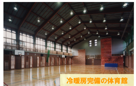
冷暖房完備の体育館

団体でご利用の方には、活動内容に合わせ、無料で活動部屋の貸出をしています。大小、様々なタイプの部屋があり、スクリーンやプロジェクターを完備した部屋もあるので、会議や研修などに最適です。スポーツを楽しみたい方のためのプレイホール（体育館）もあります。他にも、ダンス、音楽の練習や発表会など様々な活動が実施できる施設です。