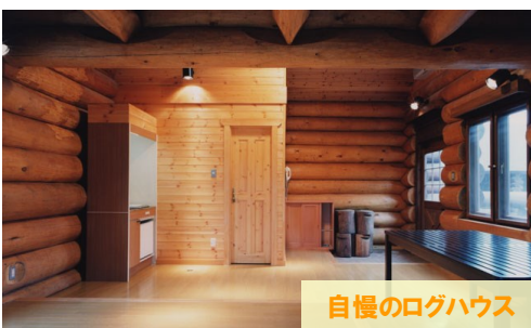
自慢のログハウス

「どんなお風呂?」「宿泊室ってくつろげるの?」というご心配、必要ありません! 広々とした大浴場は、疲れた体を癒やしてくれ、疲労回復、リフレッシュ効果抜群です。大人数でも同時に入浴することができます。片方に屋外ジャグジーもあり、夜風にあたりながら星空を眺めたり、ゆっくりとした時間を過ごすことができます。シャワー室や障がい者専用浴室も別途設置されています。しっかり疲れを取ってもらえるように宿泊室も広々空間です。冷暖房も完備しているので、いつでも快適です。