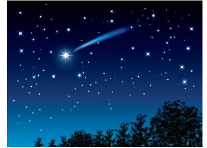
【流星】イラストより

流星（流れ星）は、太陽系にただよっているチリが、猛スピードで地球の大気突っ込んできたときに発光する現象です。毎年決まった時期に夜空の一点から流星が放射状に流れる現象で、中心点を「放射点」といい、放射点のある星座の名前をとって「〇〇座流星群」と呼ばれます。