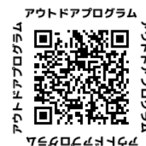
【参加申込フォーム】

※ファックスで申込みの場合、受付時間内に 到着確認のお電話 をお願いいたします。